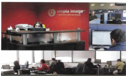
Siège social d'Utopia Image à Laval.